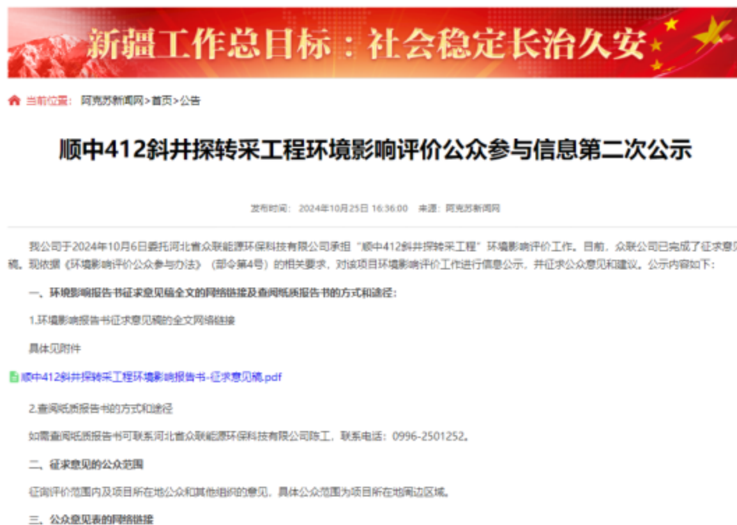
图 3-1 第二次信息公示情况

我公司于2024年10月25日至11月7日在阿克苏新闻网( http://ask.aksxw.com/sy/gg/202410/t20241025_24600874.html )上发布了征求意见稿公示信息,对环境影响报告书征求意见稿全文进行公开,公示时限为10个工作日,网站第二次公示网络截图见图3-1。