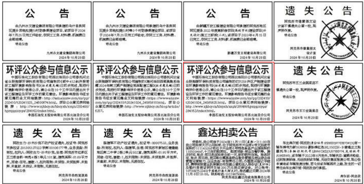
图 3-2 2024 年 10 月 28 日报纸公示情况

在网络公示的同时，我公司于 2024 年 10 月 28 日和 2024 年 10 月 29 日在阿克苏日报上发布了项目环境影响报告书公示信息，报纸公示照片见图 3-2、图 3-3。