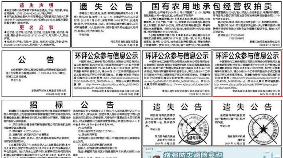
图 3-3 2024 年 10 月 29 日报纸公示情况