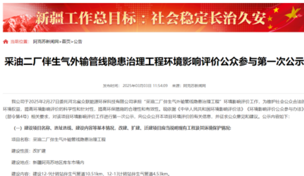
图 2-1 第一次信息公示情况

2025 年 3 月 3 日，我公司在阿克苏新闻网 ( https://www.aksxw.com/sy/gg/202503/t20250303_27026349.html ) 上发布了第一次公示信息。第一次公示网络截图见图 2-1。