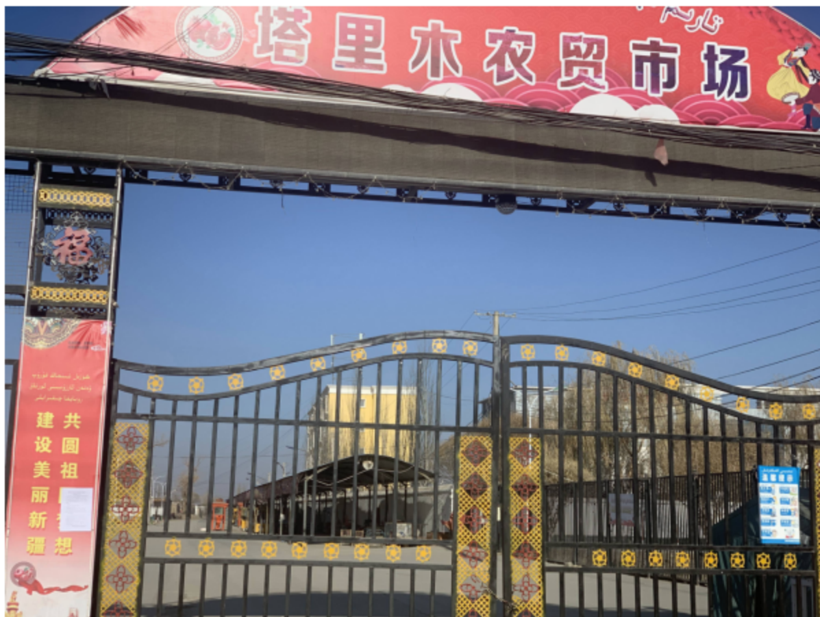
图 3-4 2025 年 3 月 15 日村庄张贴公示情况

我公司于 2025 年 3 月 15 日在周边村庄张贴了项目环境影响报告书公示信息，现场公示照片见图 3-4。