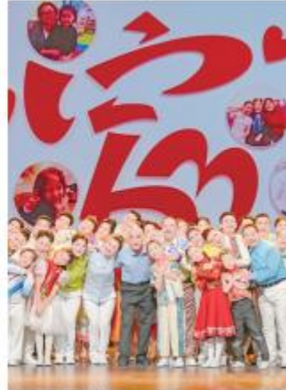
节目《一分钱的爱》精彩瞬间。