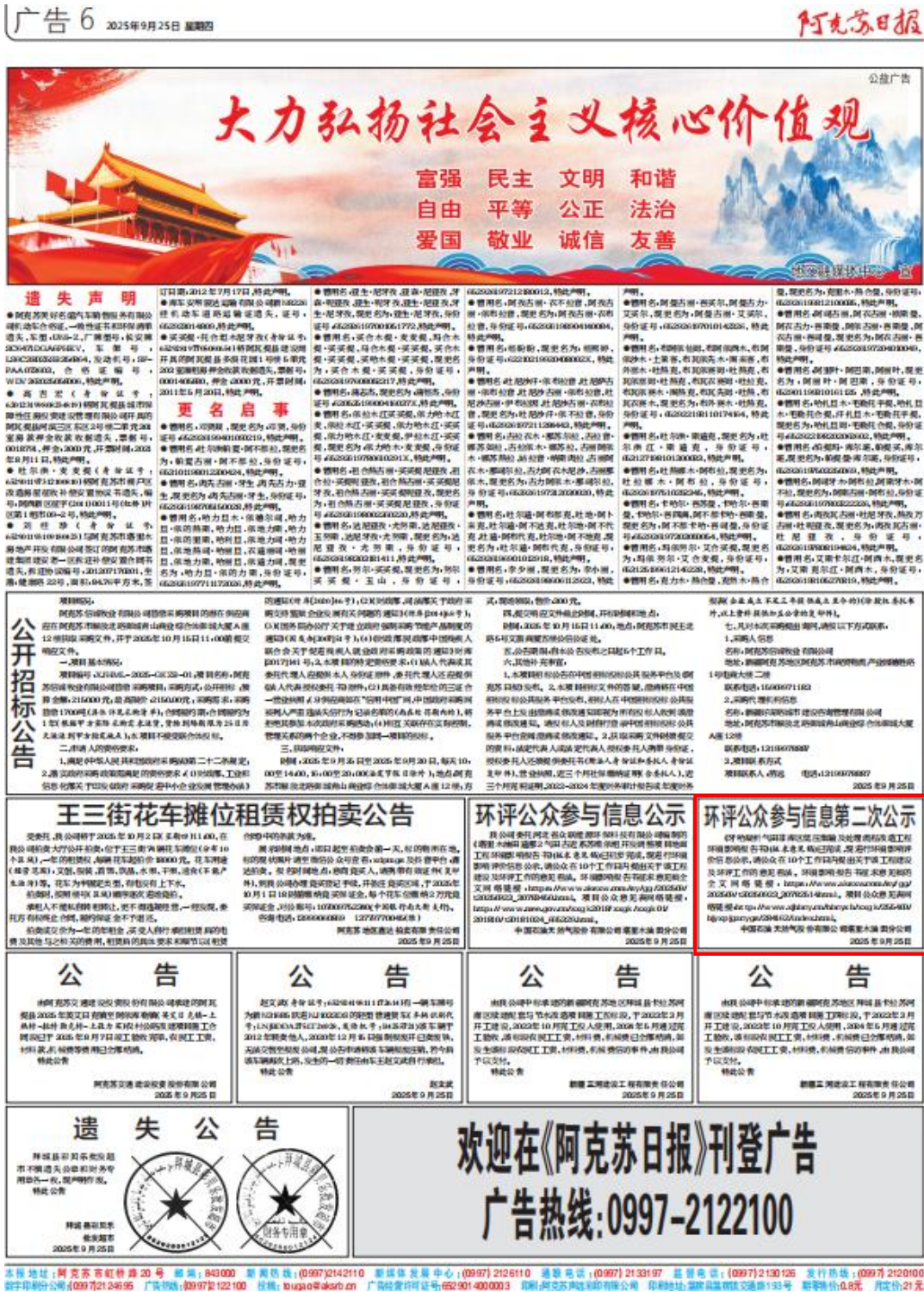
图 3-2 2025 年 9 月 25 日《阿克苏日报》公示情况

在网络公示的同时，我公司于2025年9月25日、2025年9月26日在《阿克苏日报》(刊号：CN65-0012)对本工程环评信息进行了公示，报纸公示照片见图3-2至图3-3。