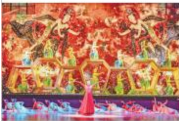
歌舞表演《丝路风情》精彩瞬间。