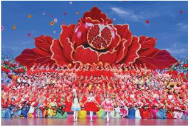
演员们在一起表演节目。