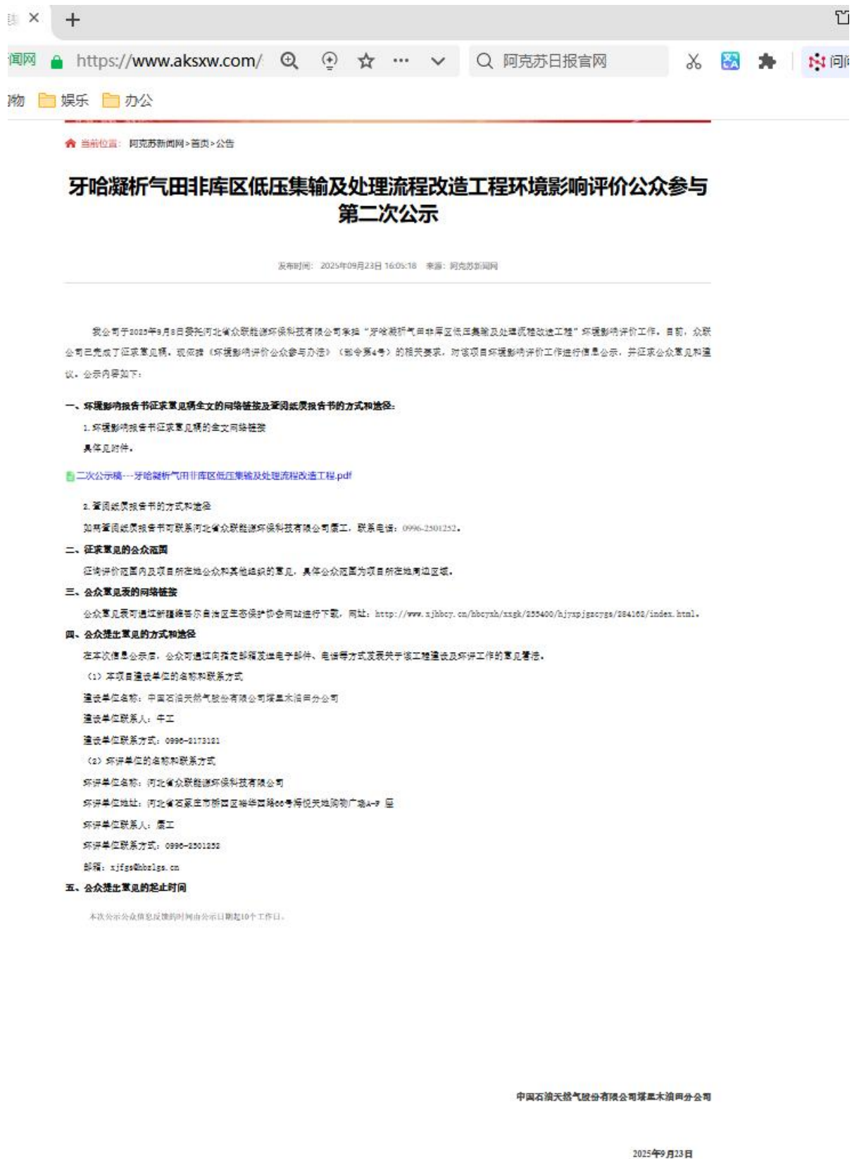
图 3-1 第二次信息公示情况