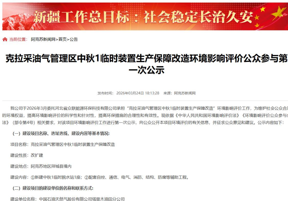
图 2-1 第一次信息公示情况

2026 年 3 月 24 日，我公司在阿克苏新闻网网站 ( https://www.aksxw.com/sy/gg/202603/t20260324_33639774.html ) 上发布了第一次公示信息。首次公示网络截图见图 2-1。