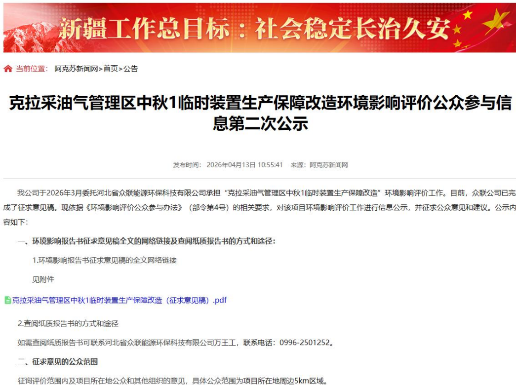
图 3-1 第二次信息公示情况

我公司在阿克苏新闻网网站( https://www.aksxw.com/sy/gg/202604/t20260413_33933303.html )上发布了征求意见稿公示信息，对环境影响报告书征求意见稿全文进行公开，公示时限为10个工作日，网站第二次公告截图见图3-1。